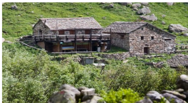
2- Rifugio Crespi Calderini