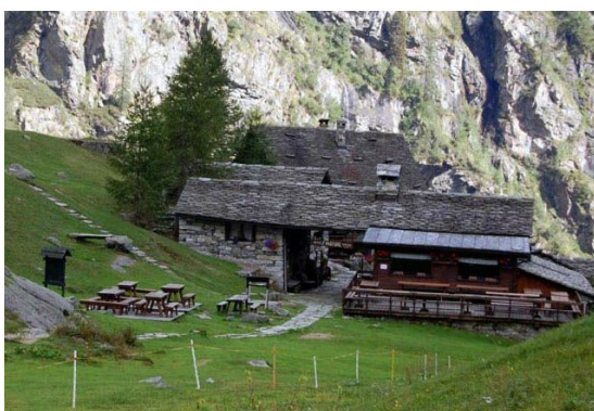
1- Rifugio Pastore