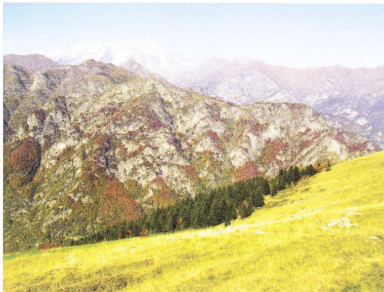
Alpe la Selvaccia

A quota 1000 m circa, prima di attraversare il Croso dell'Orso, prende avvio il nostro sentiero che sulla sinistra segue la mulattiera che sale a tornanti toccando l' Alpe Goreto , 1224m, e si snoda nel fitto bosco di abeti e larici, pervenendo all' Alpe La Selvaccia , 1557 m (ore 0.50), che si trova tra ampi pascoli al limite superiore della vegetazione arborea. Poco sopra l'alpeggio, sulla sinistra, l'itinerario 243a conduce in 30 minuti all'Alpe Il Pizzo. Volgendo invece a destra, il sentiero, poco visibile e in leggera salita (ometti), attraversa il pascolo, entra nel bosco, scende con alcuni tornanti e con lungo traverso raggiunge l' Alpe Scandalorso , 1448 m (ore 0.30-1.20), situata in panoramica posizione su un ampio declivio erboso. Da qui superate le baite in leggera salita cominciamo il lungo traverso che ci porterà all'alpe Sorbella (1636 m). Per tornare a Rassa, percorreremo la val Sorba, in base ai tempi necessari e alle condizioni atmosferiche scendendo direttamente al ponte di Prabella o per la nuova pista ciclabile con un percorso più lungo ma di grande soddisfazione.